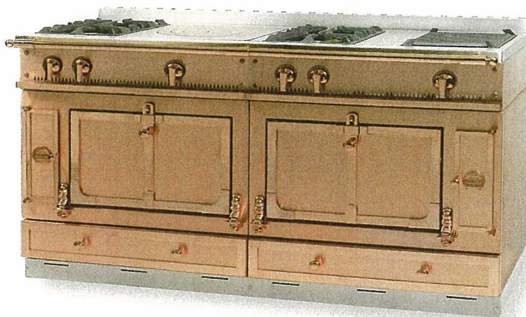
De Chateau 150, helemaal gehuld in koper, even wennen, maar het kán